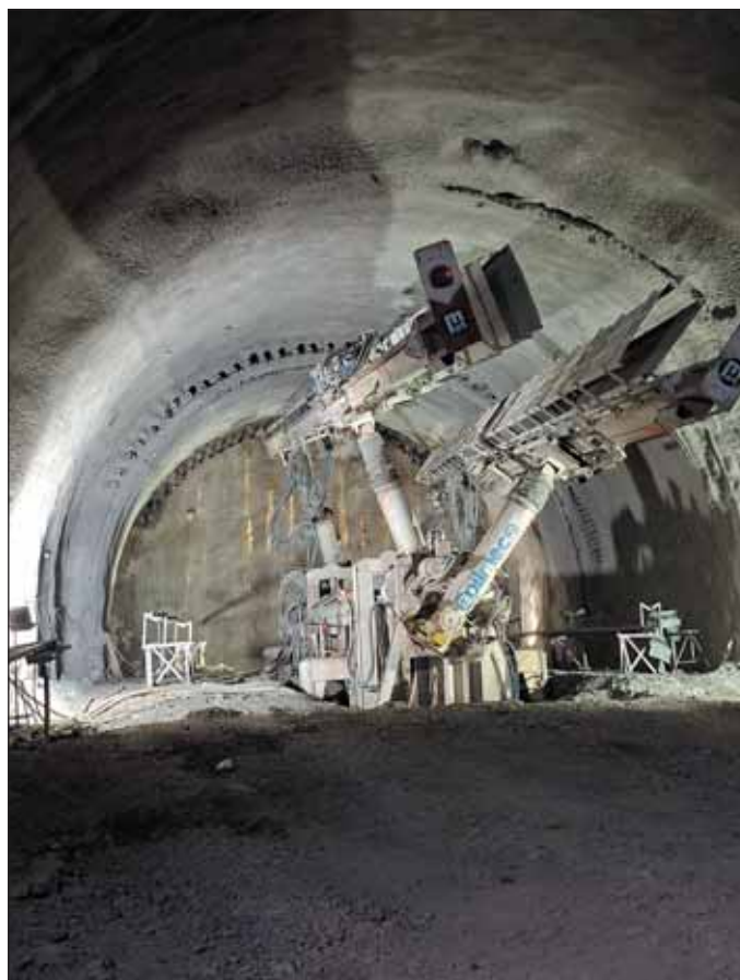
Obr. 7 Soilmec ST 120 – spevňovanie horninového prostredia Fig. 7 Soilmec ST 120 – rock mass stabilization

Recenzoval Reviewed: Ing. Petr Makásek, Ph.D.