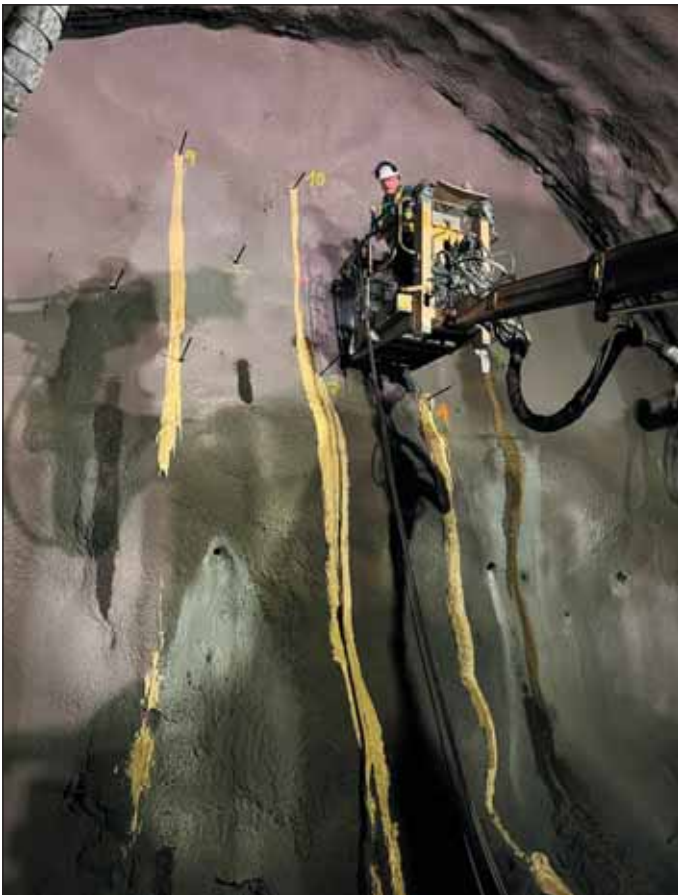
Obr. 4 Injektáž kaloty v TT5a Fig. 4 Top heading grouting in TT5a

tvorený i technologický postup s požiadavkou na rýchle zatváranie kaloty a dna tunela s odstupom kaloty od dna 4 až 10 m.