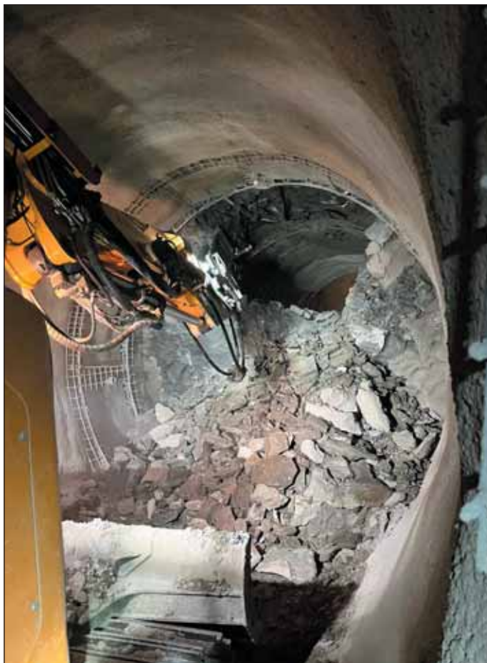
Obr. 2 Prerazenie priečného prepojenia tunelov Fig. 2 Breakthrough of the tunnel cross passage

Oproti referenčnej dokumentácii sa zhotoviteľ rozhodol pre dve zásadné zmeny technického riešenia. Navrhol jedno priečne prepojenie medzi tunelovými rúrami (obr. 2), ktoré bolo situované priamo pod cestou I/17. Toto nové riešenie spĺňalo platné bezpečnostné normy. V referenčnej dokumentácii boli navrhnuté dve priečne prepojenia, ale len z dôvodu, aby prepojenie nebolo situované priamo pod cestou. Pri samotnej razbe priečného prepojenia sa vplyvom vhodne navrhnutej technológie razenia tieto obavy nenaplnili a neboli prekročené stanovené konvergenencie v tomto úseku.