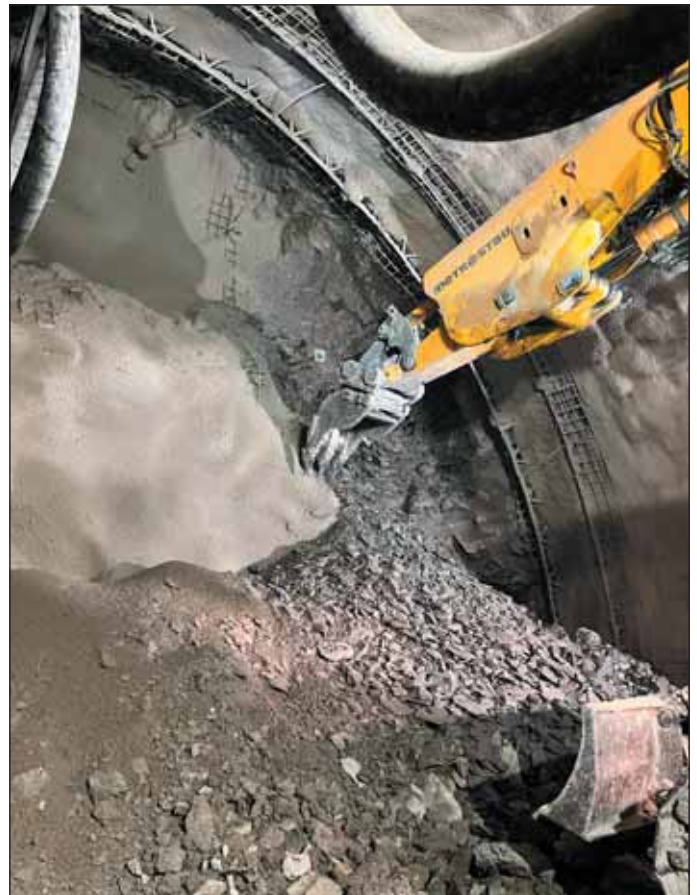
Obr. 5 Razenie kaloty v TT5a Fig. 5 Top heading excavation in TT5a

Razenie bolo začaté 22. 11. 2024 v ľavej tunelovej rúre podľa harmonogramu. V čase prípravy tohto článku bola ľavá tunelová rúra vyrazená v celej dĺžke a v pravej tunelovej rúre bolo potrebné doraziť 120 m. Pribeh razenia potvrdil lepšie parametre horniny s vyšším zastúpením geotypov K4 a K5 (horniny pevnostnej triedy R3 až R2) v kalote a potrebu nasadenia trhacích prác (obr. 6). Doplnila sa nová trieda výrubu TT2. Hornina sa vyznačovala veľkou blokovitou a tvorbou nadvýlomov. Na túto skutočnosť sa zareagovalo skrátením záberov, osadzovaním väčšieho počtu ihliel v každom zábere a osadzovaním čelových kotiev. V zóne porúch bol výrazný prechod geotypov K2 (horniny pevnostnej triedy R5)