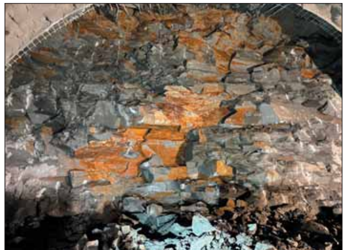
Obr. 6 Geológia TT3 Fig. 6 Geology of TT3

In fault zones, there was a significant transition between geotypes K2 (rock strength class R5) and K4, where the top heading roof was unstable, while solid rock was present at the tunnel invert level.