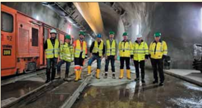
Obr. 1 Zástupci WG17 při exkurzi na BBT projektu na ZS H53 Fig. 1 WG17 delegates on ZS H53 during the excursion of the BBT

The next interesting part of the January excursion of the WG17 Working Group of the International Tunnelling Association ITA-AITES was a visit to two parts of the extensive railway tunnel Brenner Base Tunnel (BBT) construction site, under construction in the territory of Austria and Italy. It is a project of a 64km long railway connection in the Alps environment between Innsbruck and Bolzano. During operation, it will be regarded as the longest underground railway connection in the world. At the same time, the project will then be a part of the North-South European corridor operating from Helsinki to the capital city of La Valletta on the Maltese Island. Before construction the total expenses were calculated at 10.5 billion euros, with significant financial aid from the European Union evenly distributed between Austria and Italy. The plan for the tunnel opening is dated for the year 2032. The tunnel itself is excavated as a twin-tube with 70m long cross-passages every 333m of the length of the tunnel. Even before commencing the construction of the main tunnels 10.4m in diameter an excavation of an exploratory tunnel approximately 6m in diameter began, which takes place 12m underneath the invert of the railway tunnel. In the future this exploratory