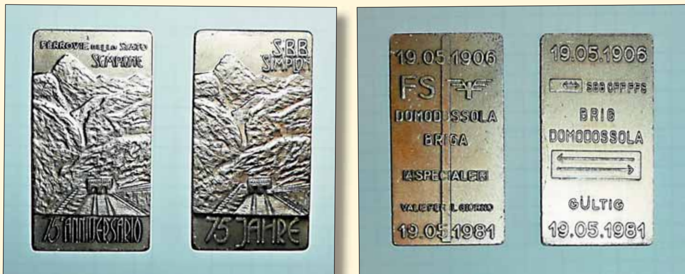
Obr. 10 Pamětní jízdenky na zvláštní jízdu vlaku ze dne 19. 5. 1981 mezi Domodossolou a Brigem, u příležitosti 75. výročí zahájení provozu v železničním tunelu Simplon.

Avers a revers jízdenek je v německé a italské verzi (podle úředního jazyka obou železničních společností). Materiál – kov (Zn slitina?). Rozměry i údaje na reversu těchto zpátečních jízdenek odpovídají klasickým kartónovým lístkům rozměru 30 × 55 mm.