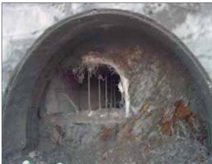
Obr. 2 Průzkumná štola tunelu Valík Fig. 2 Exploratory gallery for the Valík tunnel

Délka tunelu je přibližně 1300 m, celková délka ražených částí je přibližně 2200 m.