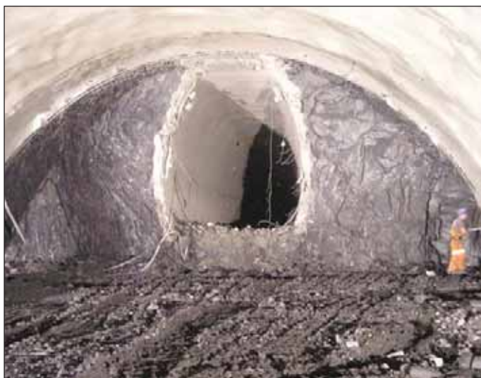
Obr. 3 Průzkumná štola tunelu Komořany Fig. 3 Exploratory gallery for the Komořany tunnel

Koncem roku 2007 započala úpadní ražba obou tunelových trub ze stavební jámy Cholupice, takže se razila současně ražba na 4 čelbách. Tunel byl uveden do provozu v roce 2010.