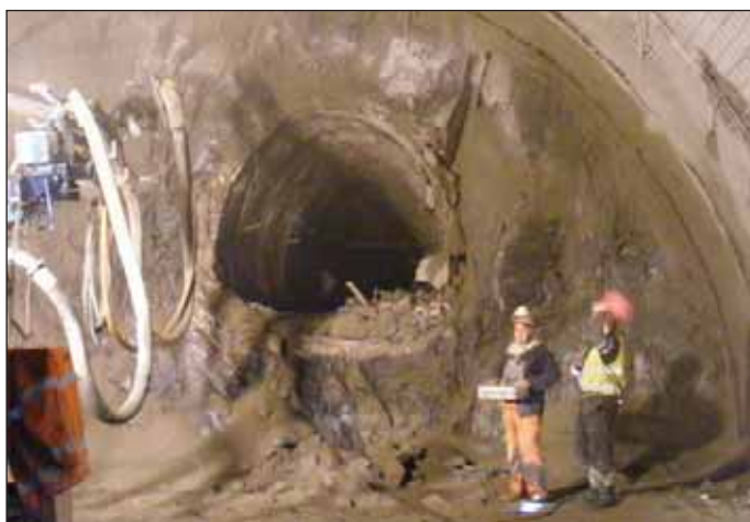
Obr. 7 Průzkumná štola tunelu Královská obora Fig. 7 Exploratory gallery for the Královská Obora tunnel

Za průzkumné štoly označujeme tunelová liniová podzemní díla, která jsou zpravidla umístěna v profilu budoucího tunelu. Průzkumné štoly jsou součástí geotechnického průzkumu. Velikost těchto liniových podzemních staveb není omezena a název „štola“ je užíván i u profilů větších, než je obvyklá formální hranice 16 m 2 .