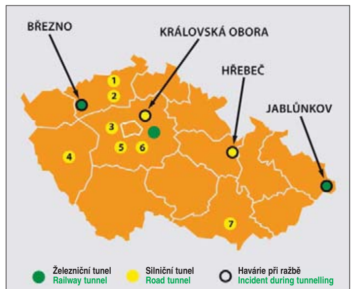
Obr. 1 Orientační poloha silničních a železničních tunelů s průzkumnými štolami realizovaných NRTM v letech 1990–2010 na mapě ČR (1 – Panenská, 2 – Prackovice, 3 – Mrázovka, 4 – Valík, 5 – Slivenec SOKP 514, 6 – Komořany SOKP 513, 7 – Královopolský)

This paper brings a summary of all road and railway tunnel projects and exploratory galleries driven for them by the NATM within the 1990 – 2011 period in the Czech Republic (see Fig. 1). They are presented by means of basic parameters of the galleries and future tunnels. The tunnels are arranged in a chronological order, according to the construction time. Since several incidents happened during the period of the transport tunnels construction being surveyed, which is a problem closely associated with the problems discussed in this paper, the more serious incidents are also mentioned.