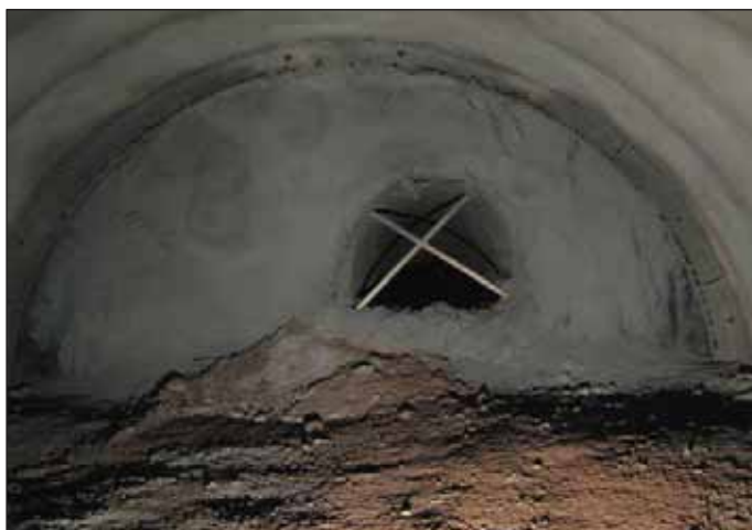
Obr. 6 Průzkumná štola tunelu Prackovice Fig. 6 Exploration gallery for the Prackovice tunnel

budoucí severní tunelové trouby (STT). V úseku s nízkým nadloží pod parkem Stromovka byla z průzkumné štoly dělána rozsáhlá sanační opatření pro zlepšení podmínek budoucích ražeb.