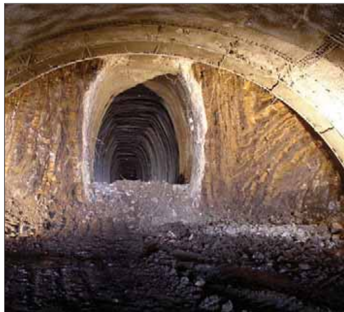
Obr. 4 Průzkumná štola tunelu Slivenec Fig. 4 Exploratory gallery for the Slivenec tunnel