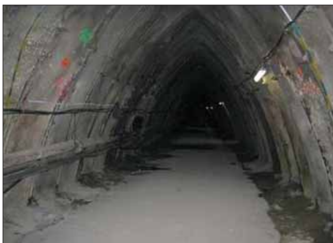
Obr. 5 Průzkumná štola Královopolského tunelu Fig. 5 Exploration gallery for the Královo Pole tunnel

Průzkumná štola o celkové délce 1950 m je ve své převážné délce vedena v profilu budoucí jižní tunelové trouby (JTT) a umístěna excentricky do vrcholu kaloty budoucího tunelu (obr. 7). Štola s profilem 10,5 m 2 byla realizována s kolejovou dopravou s výhybnami po 150 m. V úseku s nejnižším nadloží na úpatí svahu z Letné (oblast bývalé Šlechtovy restaurace) a také pod Vltavou byla průzkumná štola ražena i v profilu