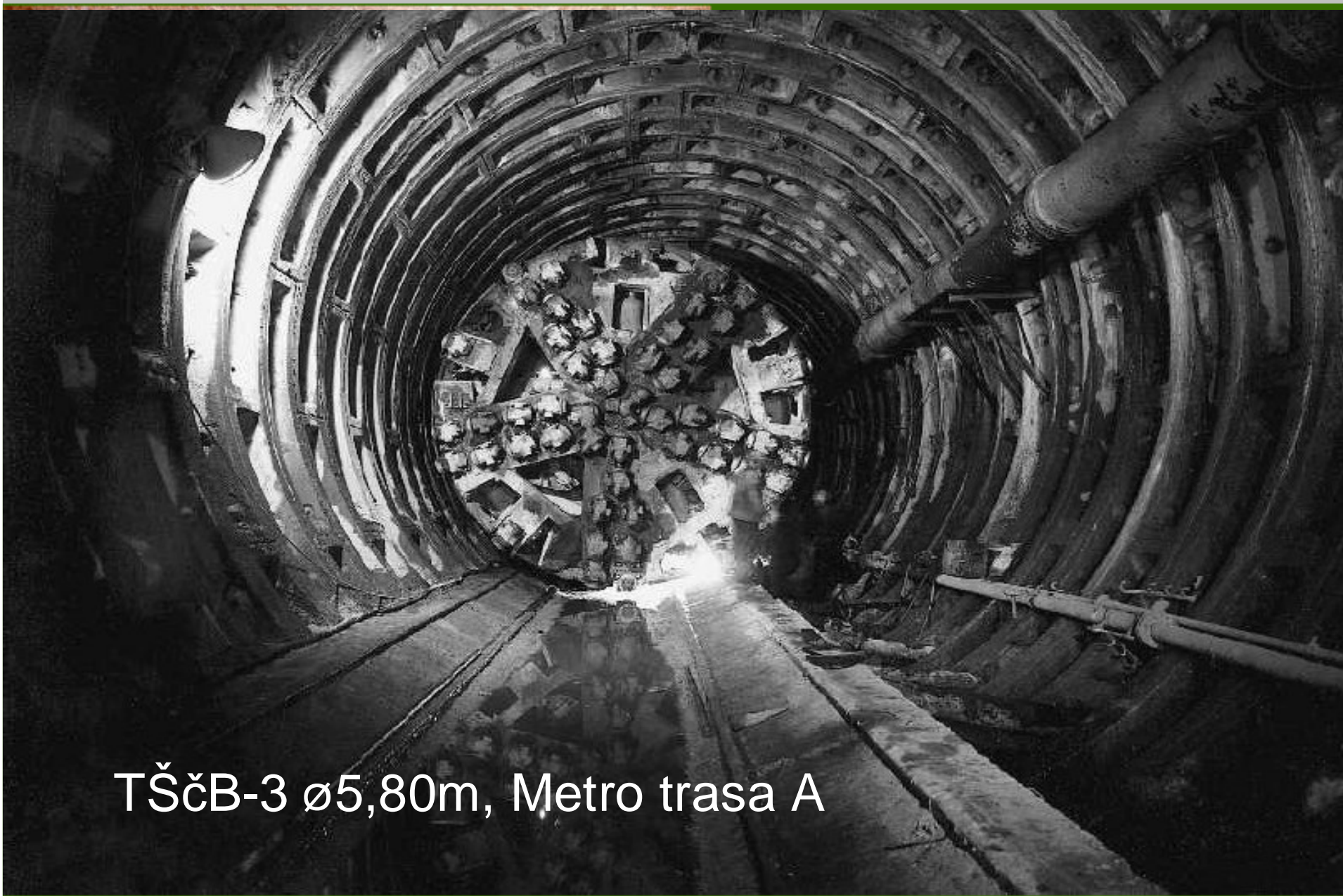
TŠčB-3 ø5,80m, Metro trasa A