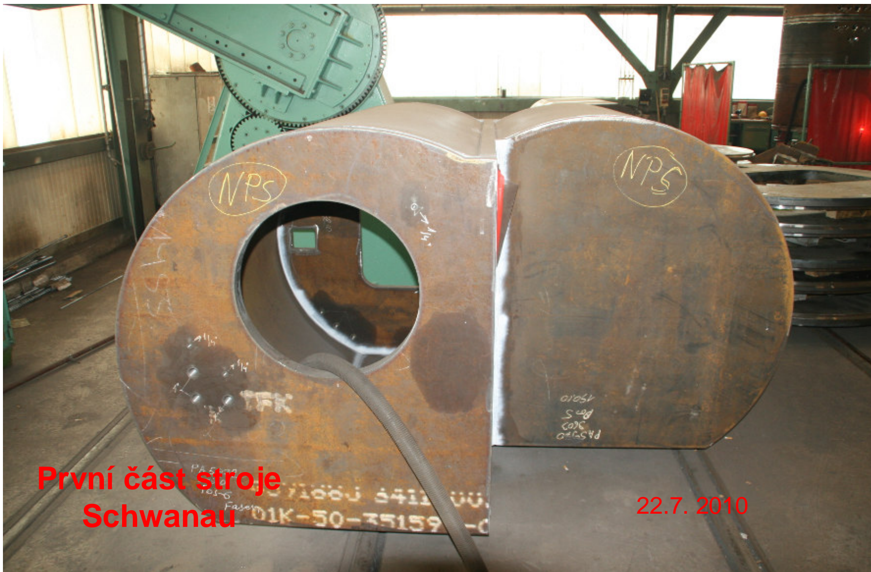
První část stroje Schwanau