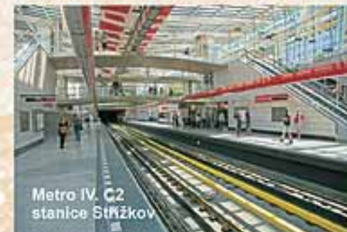
Metro IV. C2 stanice Střžkov