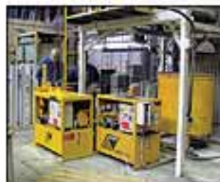
Injektážní sestava Hány ZMP 710 s kolovými míchačkou