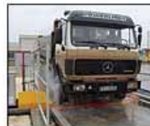
Myčka kol Moby Dick Junior