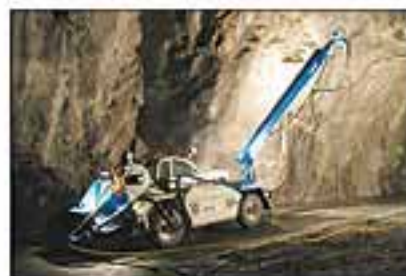
Meyco Spritzmobil Poca - do středních profilů