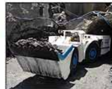
Kolový nakladač LF-4.5

SWISSGREEN, Šumavská 15, CZ-602 00 Brno Tel.: +420 541 592 323 • Fax: +420 541 592 424 swissgreen@swissgreen.cz • www.swissgreen.cz