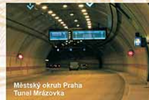
Městský okruh Praha Tunel Mrázovka