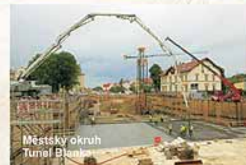
Městský okruh Tunel Blanka