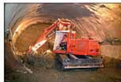
Tunelový bagr TEREX TE 210 - 28 t